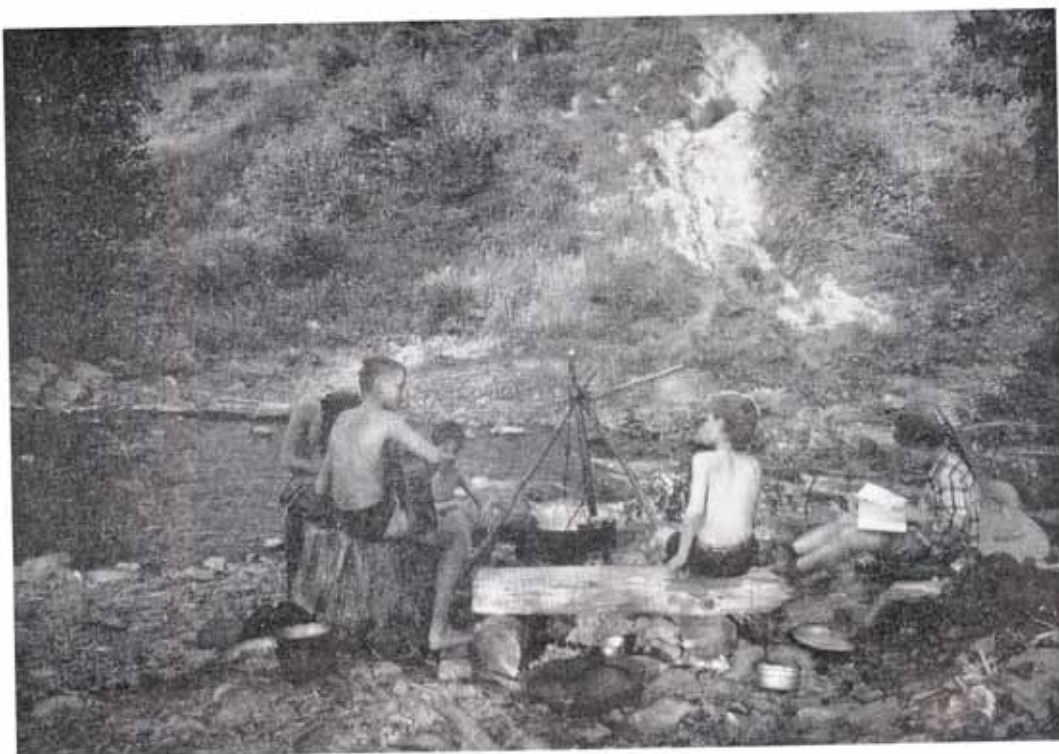
Kochen am Fluß

Also gingen wir weiter und fanden schließlich eine kleine Scheune, die ganz einsam am Waldrand stand. Wir richteten uns ein. Oben war richtig viel frisches Heu, allerdings mußte man klettern, um hinaufzukommen. Deshalb blieben ein paar von uns unten. Anschließend kochten wir Abendessen, denn wir hatten großen Hunger und sangen dann hinter der Scheune am Feuer Lieder. Da kam auf einmal im Dunkeln ein ziemlich betrunkenener alter Mann. Der schimpfte und tobte und meinte, daß wir hier auf seinem Grundstück wären und hier auch nicht schlafen dürften.